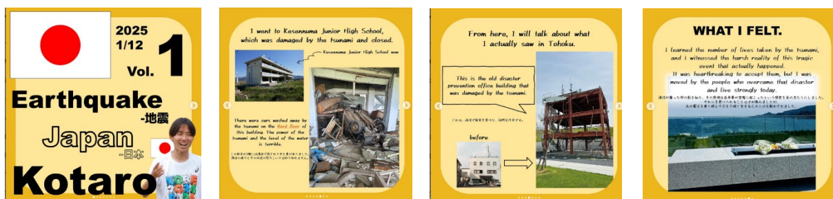
写真 2, 3, 4, 5 SNS での東日本大震災遺構訪問のレポート